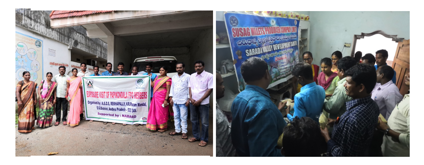
Exposure visit to SVDS – Anakapally FPOs

On 22.10.2020 Board of Directors went to Sarada Valley Development Society (SVDS) – Anakapally for exposure visit to see successfully running FPOs 1. SUSAG millets FPO and 2. BARGAV FPO to get business development awareness, on 22.03.2020 went to exposure visit to Girijana Vikas NGO promoted Andhra Kashmir tribal farming FPO located at Tajangi village of Chintapally Mandal of Visakhapatnam District.