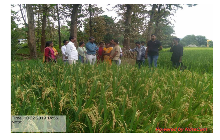
PO – ITDA Chintur visited NPM field