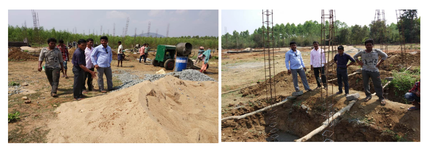
Village level R & R committee members monitoring of R & R colonies construction works