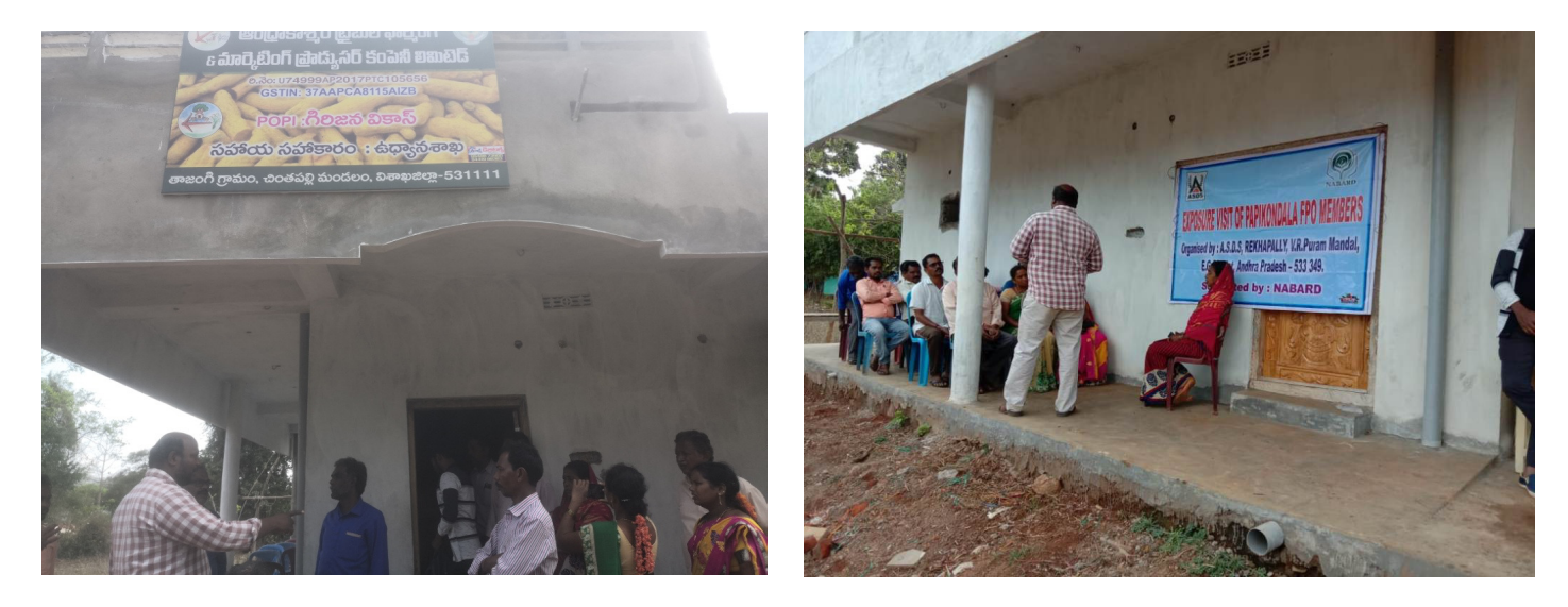
Exposure visit to Girijana Vikas – Tajangi - Chintapally